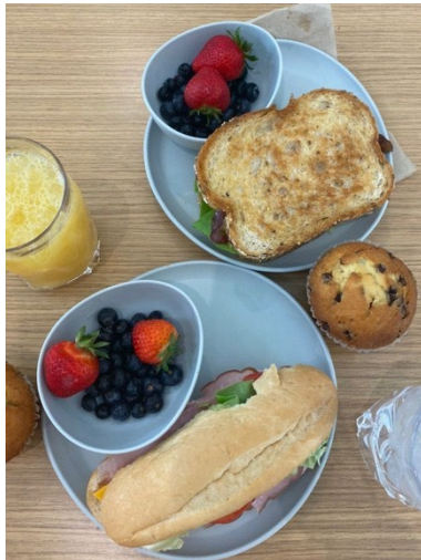
Frühstück in der Dining Hall