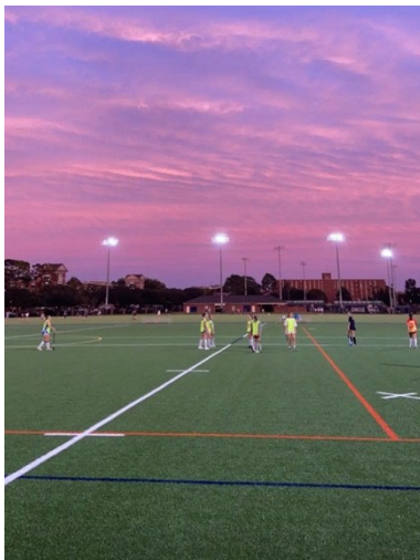
Einer der vielen wunderschönen Sonnenuntergänge