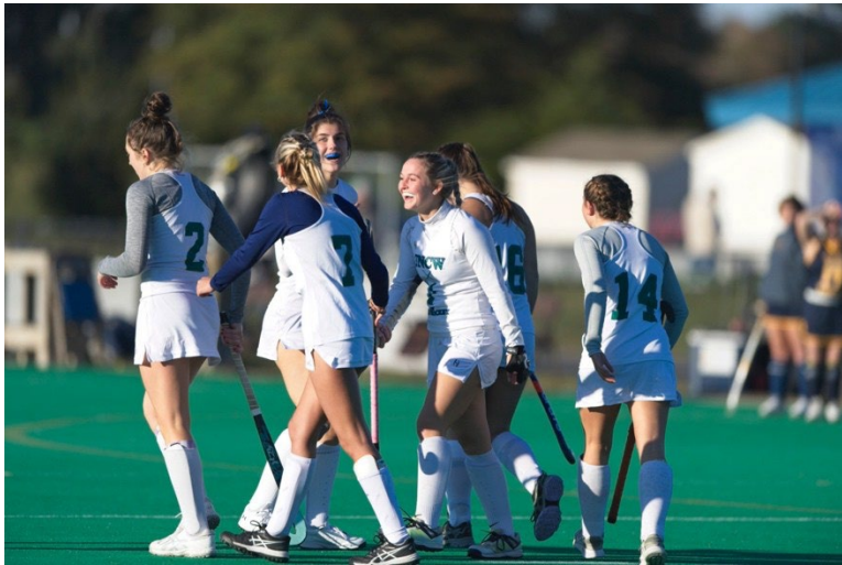
Club Field Hockey