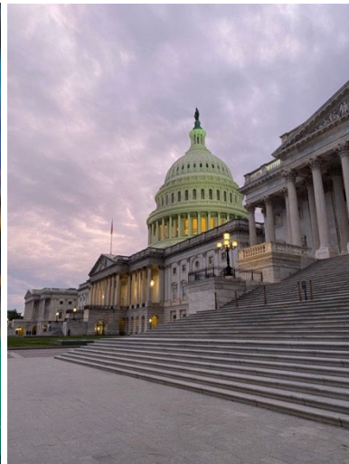
Washington D. C.