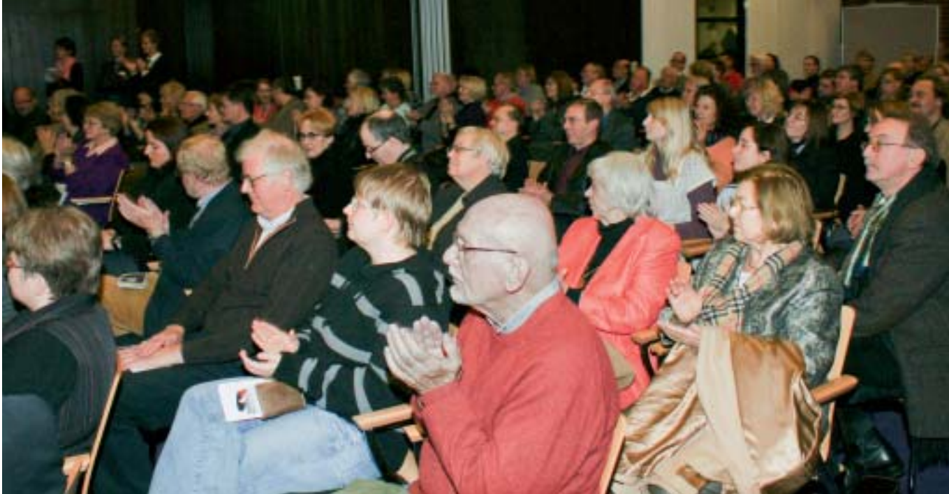
„Volles Haus“ in der ULB zur Thomas Mann-Nacht „Im Bann des Zauberers“