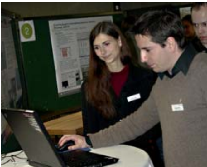
Poster und Projekte fand viel Anklang bei den Besuchern.