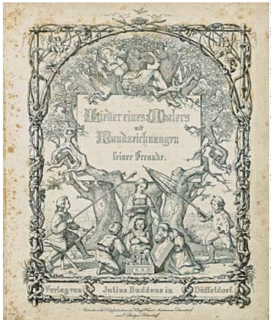
Aus: Reinick, Robert: Lieder eines Malers mit Randzeichnungen seiner Freunde. Düsseldorf: Buddeus, [z.w. 1839 und 1846]

Beispiel ist die „Düsseldorfer Malerschule“, die mit dem Beginn von Wilhelm von Schadows Tätigkeit als Direktor der Kunstakademie 1826 zu höchster Blüte kam. „Er hat seine Schüler protegiert, sie in die Gesellschaft eingeführt und ihnen