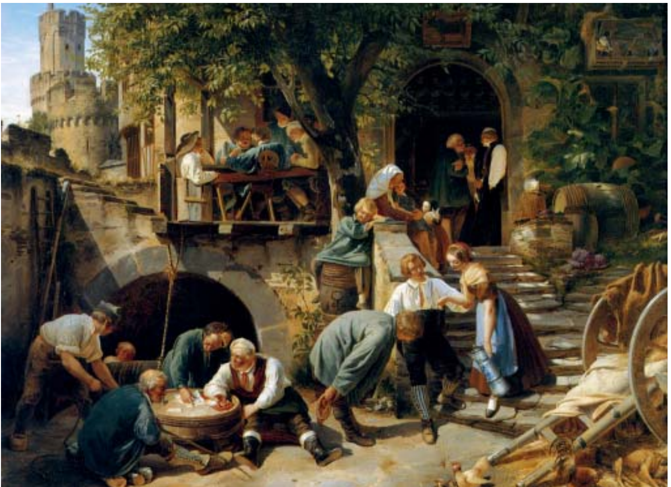
Rheinische Wirtshausromantik. Schroedter leitet sein Signet (hier auf dem Fass in der Bildmitte) von seinem Namen ab. Es findet sich auf den meisten seiner Bilder. Adolph Schroedter, Rheinisches Wirtshaus, 1833, Öl auf Leinwand, 58,5 x 71,2 cm, LVR-LandesMuseum Bonn, Rheinisches Landesmuseum für Archäologie, Kunst- und Kulturgewerbe

Kunstmuseum Düsseldorf im Ehrenhof / Galerie Paffrath (Hg.): Lexikon der Düsseldorfer Malerschule, 1819 – 1918, 3 Bde., München 1997/98, Bd. 3, S. 239