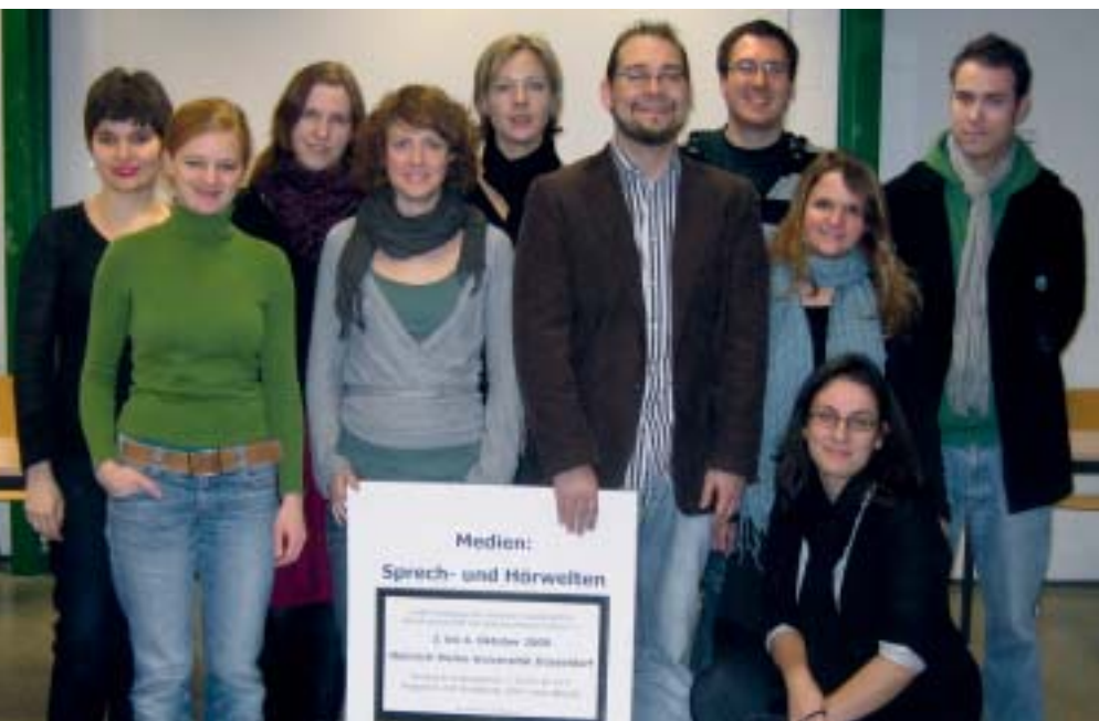
Das Organisationsteam der Tagung „Medien: Sprech- und Hörwelten“, veranstaltet von der Deutschen Gesellschaft für Sprechwissenschaft und Sprecherziehung