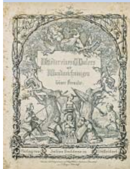
Titelblatt, Robert Reinick, „Lieder eines Malers“

Eigentlich sollte es „nur“ ein Nachfolgebau für die inzwischen abgerissene Fachbibliothek der Medizinischen Fakultät werden, doch dann nahm die Bauplanung eine Wende. Von der neuen O.A.S.E. auf dem Campus lesen Sie ab Seite 10.