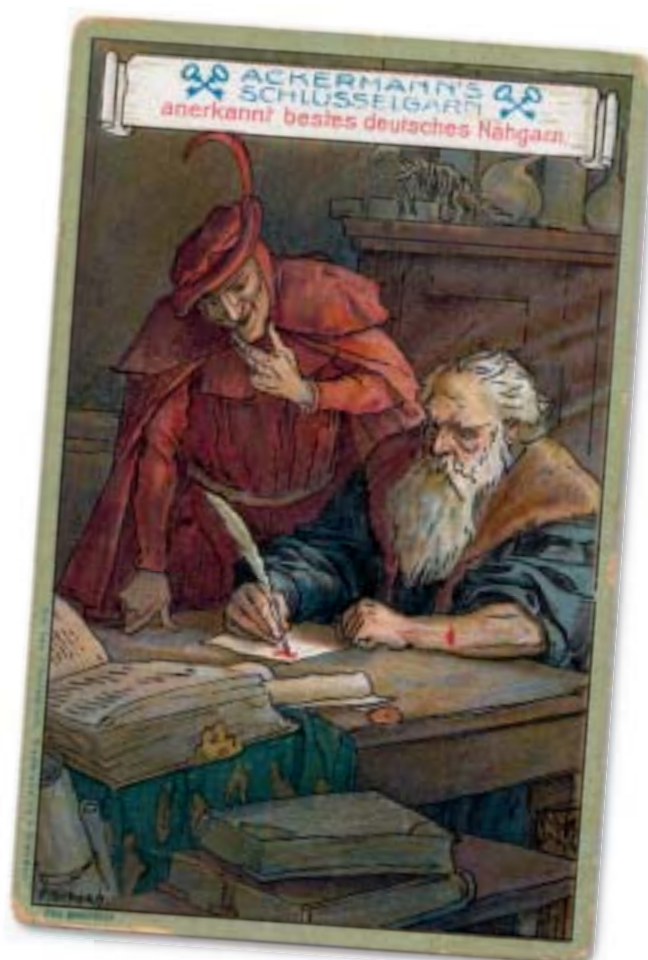
„Blut – ein besonderer Saft“: populäres Zitat aus Goethes „Faust“, - hier als Motiv eines Sammelbildes aus den 20er Jahren.

Dieser fakultätsübergreifende Charakter ist Ausdruck der vitalen Partnerschaft der Universitäten Prag und Düsseldorf. Die nächste Partnerschaftstagung soll in zwei Jahren turnusgemäß wieder in Düsseldorf stattfinden. Ein Sammelband, der die Beiträge der Konferenz vereint, wird von den Prager Organisatoren vorbereitet.