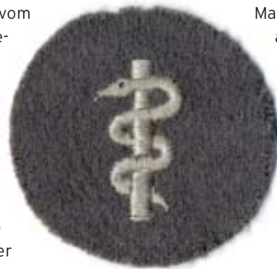
Ärmelabzeichen der Sanitätstruppe der Bundeswehr, 1972