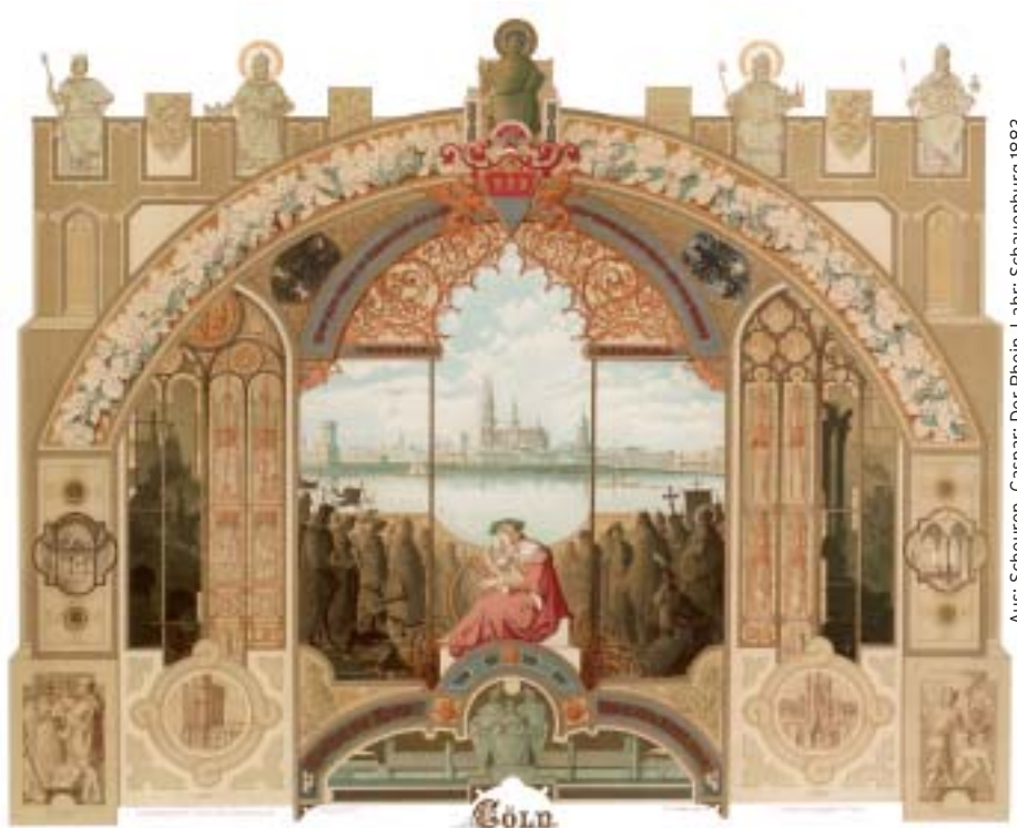
Eine Ansicht von Köln. Cöln. Illustration von Caspar Scheyren

Aus: Scheuren, Caspar: Der Rhein. Lahr: Schauenburg 1883