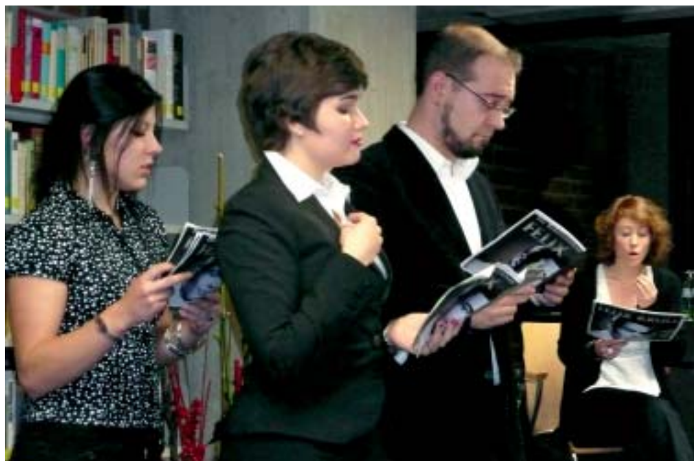
Studierende und Mitarbeiter des Bereichs Mündlichkeit (Germanistik IV) der HHU bei einer szenischen Lesung aus Manns „Bekenntnisse des Hochstaplers Felix Krull“

Alle Erwartungen übertraf die große Zahl der Gäste - überwiegend Stadtbesucher, aber auch Gäste aus Bonn und Stuttgart -, die gleich zu Beginn den Wechsel in einen größeren Raum erforderlich machte. Dies und das positive Feedback belegen, dass die ULB ihr Ziel erreichen konnte, als kulturelle Einrichtung in Düsseldorf wahrgenommen zu werden und die Stadt in die Universität zu holen.