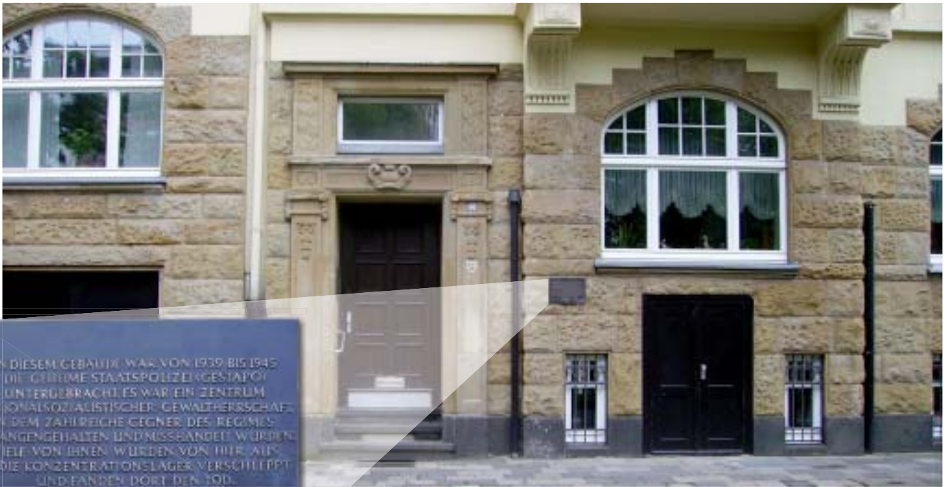
Eine Gedenktafel an Haus Nr. 96 der Düsseldorfer Prinz Georg Straße erinnert an das Grauen hinter schönen Hausfassaden: Hier befand sich das Gestapo-Hauptquartier, in dem zahlreiche Opfer gequält und von hier aus in den Tod in einem Konzentrationslager geschickt wurden.

und Kontrolle der westlichen Reichsgrenze gegenüber den Niederlanden, Belgien und Luxemburg, eine wichtige Rolle, da es hier galt, sowohl Fluchtbewegungen aus dem Reich als auch die Infiltration ausländischer Agenten zu verhindern.