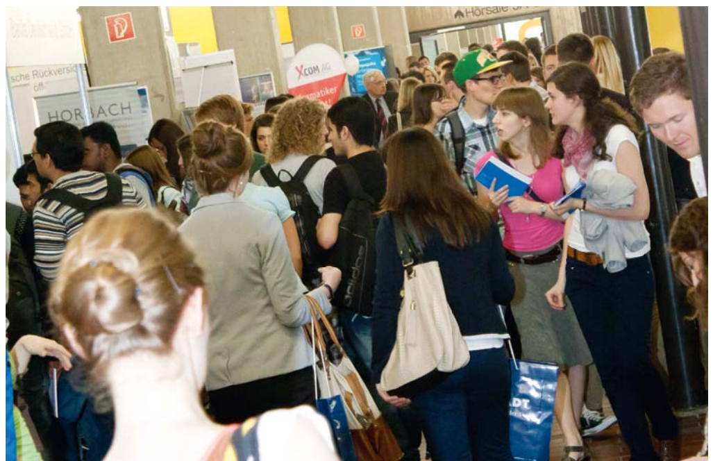
► Mit rund 2.500 Besuchern verzeichnete die Messe einen neuen Besucherrekord.