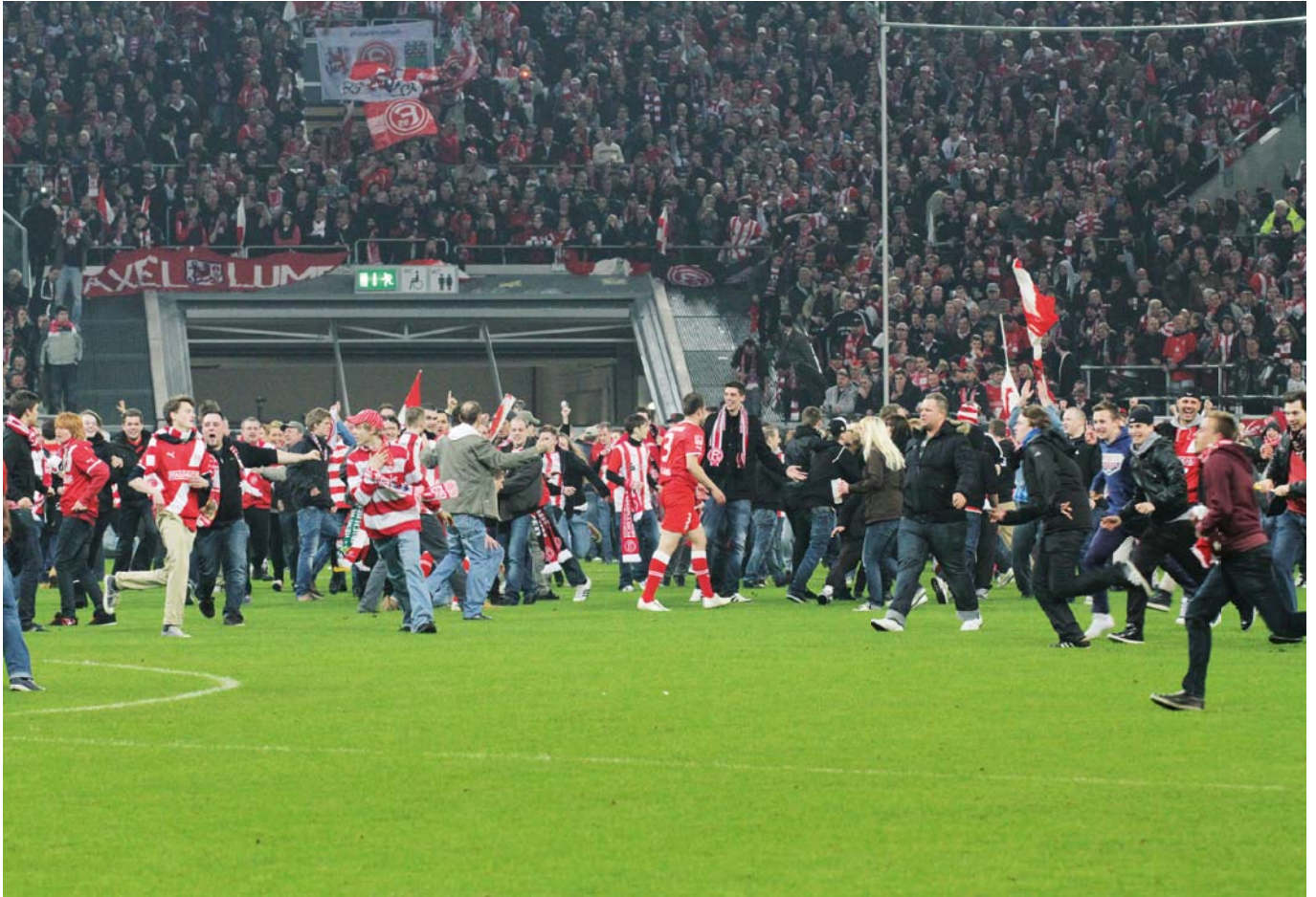
► Fans von Fortuna Düsseldorf stürmen am 15. Mai beim Relegations-Rückspiel gegen Hertha BSC auf das Spielfeld.