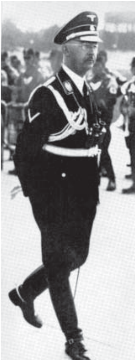
Reichsführer-SS Heinrich Himmler (1900 - 1945). Ihm unterstanden der gesamte Polizeiapparat des Dritten Reiches (Ordnungspolizei, Geheime Staatspolizei, Reichskriminalpolizei) sowie der Sicherheitsdienst (SD). Auch die Düsseldorfer Lageberichte der Gestapo liefen über seinen Schreibtisch.

8.500 Menschen, die ein einziger Gestapo-Mitarbeiter zu kontrollieren hatte. Die Gestapostelle Berlin hatte zu diesem Zeitpunkt 410 Bedienstete und fiel insofern aus dem Rahmen.